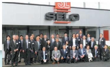
2017年度はチェコ、ドイツを視察しました。2018年度は中国・深圳を訪れます。

各夕食会に、ジェトロや現地企業の駐在員など現地事情に詳しい方々をお招きし、生の情報に触れる機会を設けるなど、投資育成ならではの企画で、毎年、募集開始直後に定員に達してしまう人気イベントです。