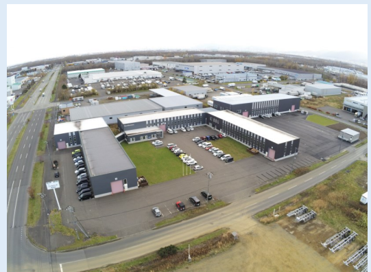
シンセメック本社工場全景